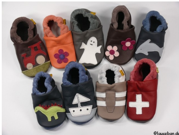
Eine kleine Modellübersicht

Die Puschen sind ein ideales Geschenk zum Geburtstag, zur Taufe oder einfach nur so als Mitbringsel. Sollten Sie sich mit der Größe oder dem Modell unsicher sein, biete ich Ihnen Gutscheine in individueller Höhe.